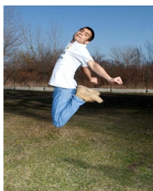
Žiadateľ o azyl, Pobytový tábor Rohovce

S osobou, ktorá musela dobrovoľne opustiť svoju krajinu a vydať sa na neľahkú cestu za lepšou budúcnosťou? Na cestu, ktorá má jasný začiatok, ale veľmi